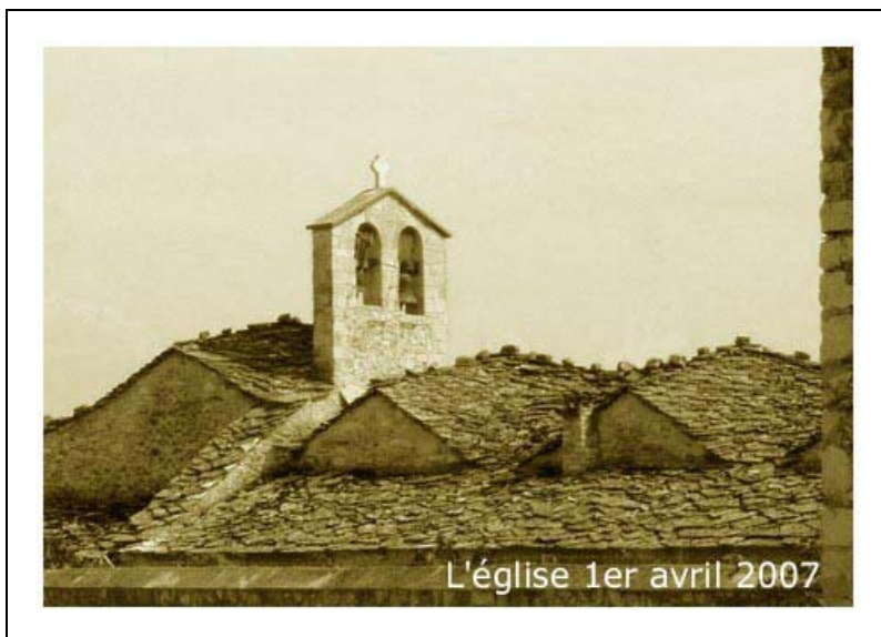
Le clocher peigne-arcade.

Je vous précise enfin que nos deux cloches ne sont liées à aucun serment et qu'elles sont libres d'aller à Rome ... si elles le désirent !!!